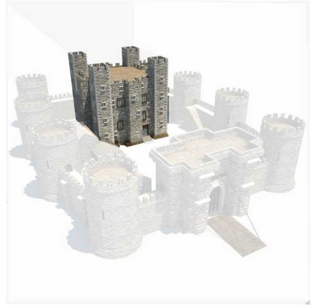
Torre del Homenaje