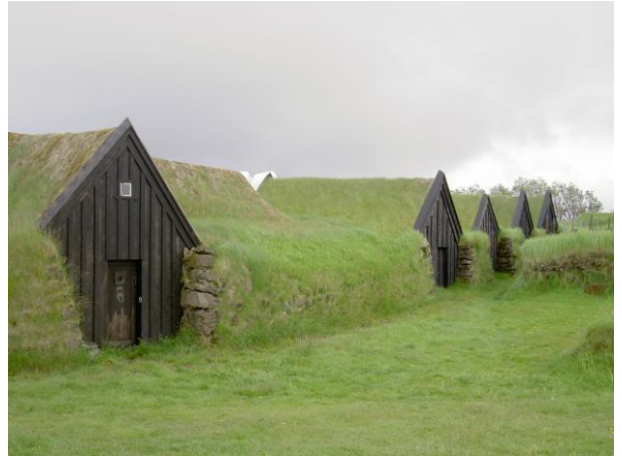
CASA EN LA TIERRA