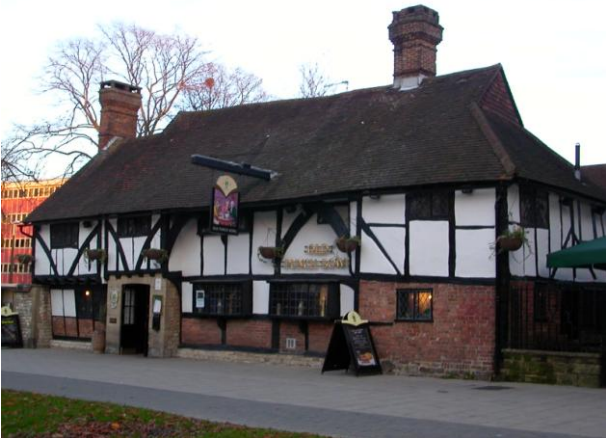
WEALDEN HALL HOUSE